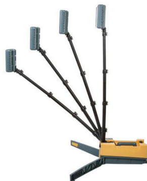
Bras télescopique inclinable vers l'avant pour faciliter l'éclairage des regards, bouches d'égout, puits, etc, et des entrées de canalisations.