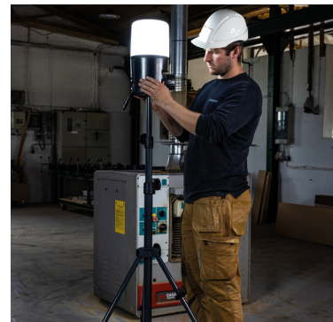
Poignée de transport intégrée