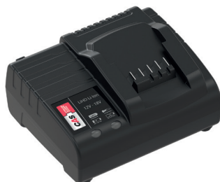
Chargeur CAS intelligent* 42203