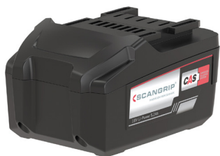
Batterie CAS 18V 5.2 Ah 42202