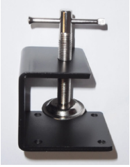
ETRIER pour SunMach 10W