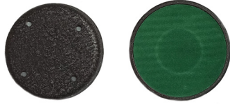
Pied magnétique pour SunMach 10W