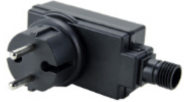
Transfo-prise 230V Europe