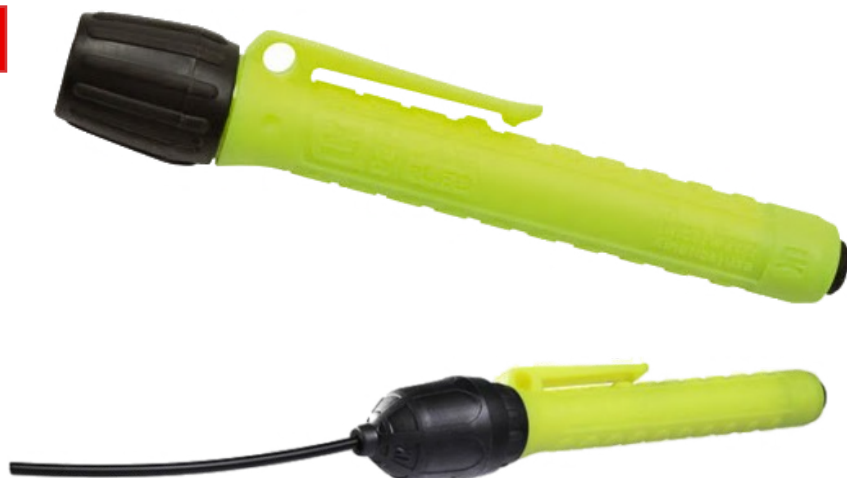
Sun Pen ATEX avec fibre optique