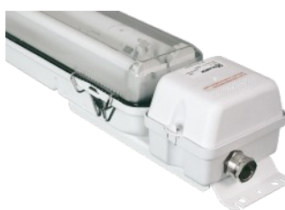
Boîtier de batterie externe