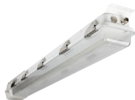
Max 1200 équipé d'un boîtier de batterie externe

L'éclairage MAX se décline en plusieurs modèles.