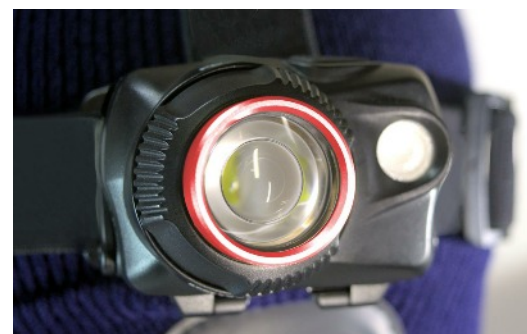
Frontale équipée de 2 LEDs