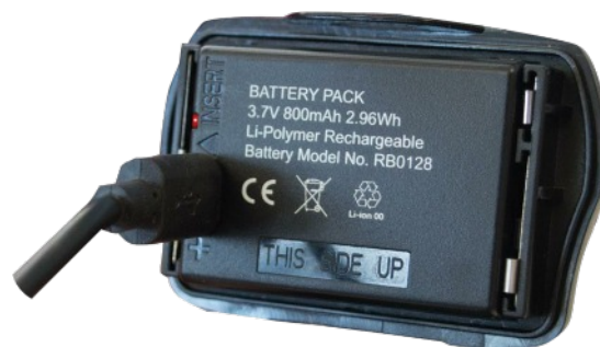
Batterie Li'ion avec voyant d'indicateur de charge