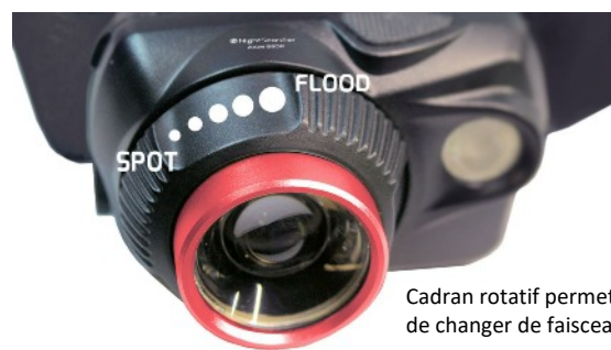
Cadran rotatif permettant de changer de faisceau